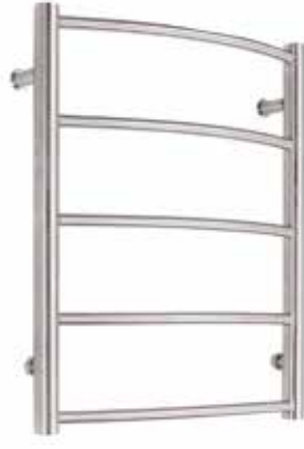
SENTAKIA OCE 5 650 x 540 mm rosteri