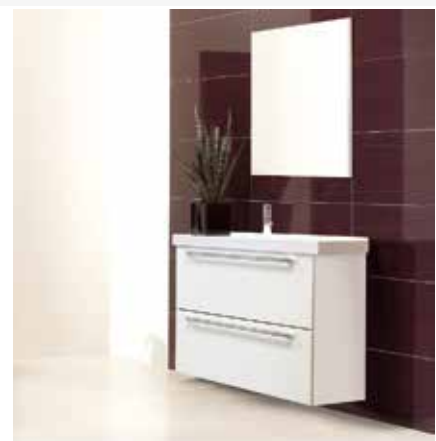
TEMAL Temalette TL8040