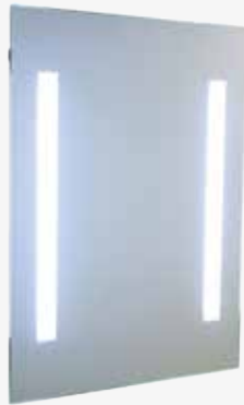
OPAL 600 mm pistorasialla