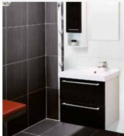
TEMAL Temalette TL6040