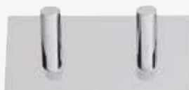
CELLO Spa 2 ja 4 koukkua