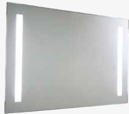
OPAL 900 mm pistorasialla