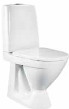
IDO Seven D korotettu