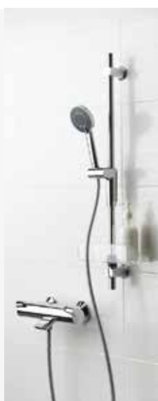
ORAS OPTIMA 7149