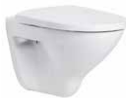
IDO Seven D seinä-wc