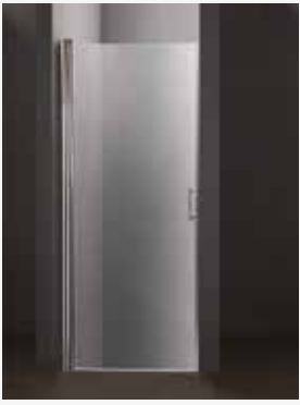
OPAL suora 700-800 mm kääntyvä