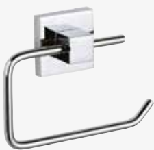
CELLO Spa kantikas