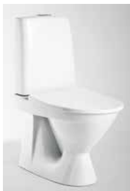
IDO Seven D