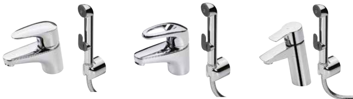
ORAS VEGA 1812/1810