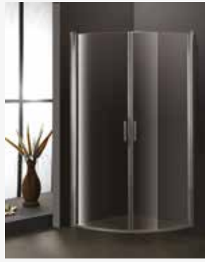
OPAL Suihkunurkka 900 x 900 mm kirkas