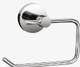
CELLO Spa pyöreä