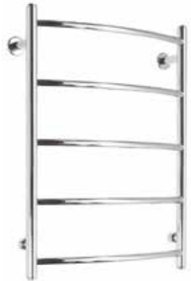
SENTAKIA LC 5 650 x 500 mm kromi