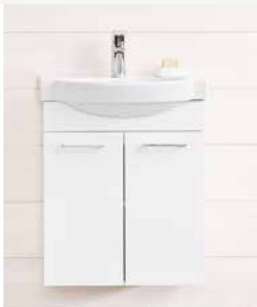
IDO Renova plus hylly/laatikko